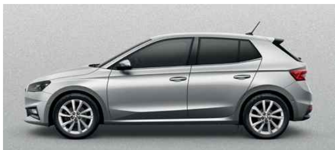
Metāliska krāsa Brilliant Silver