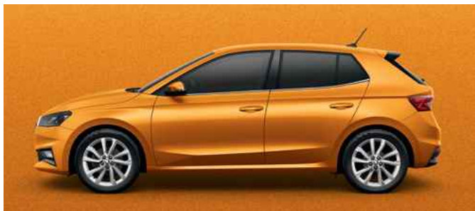
Metāliska krāsa Phoenix Orange