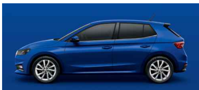
Nemetāliska krāsa Energy Blue