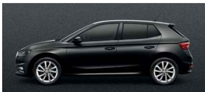
Metāliska krāsa Magic Black