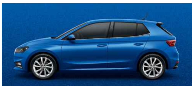
Metāliska krāsa Race Blue