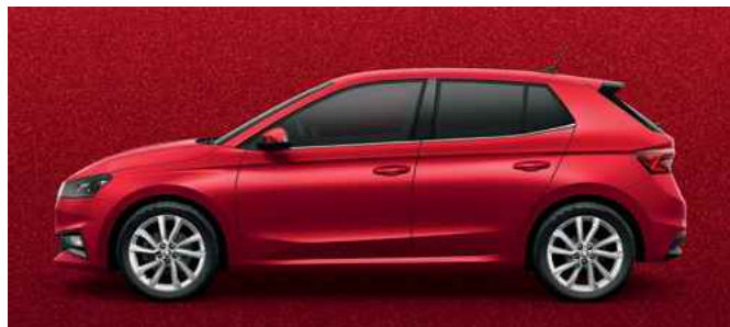
Metāliska krāsa Velvet Red