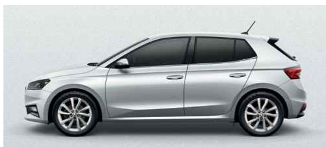
Metāliska krāsa Moon White