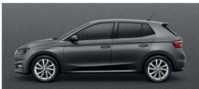
Metāliska krāsa Graphite Grey